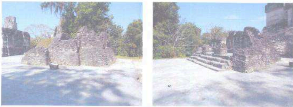
2013. ACROPOLIS DEL NORTE. PANORÁMICA ANTES Y DESPUES DEL PROCESO DE ARRANCADO DE VEGETACIÓN.